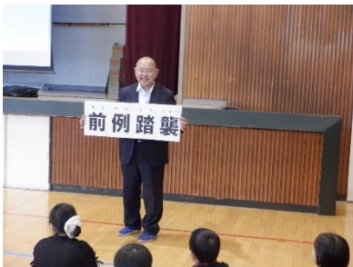
ハケ岳移動教室に向けた学年集会で「前例踏襲」の打破を訴える校長

これで火のついた5年生たち。もともと、4年生のときに、運動会のオリジナルダンスを考えたり、「潤フェス」に学級単位で出場したりと、自分たちで考えることが大好きな学年ですから、ラストパートで移動教室のオリジナル企画を考え、食事係のパフォーマンス挨拶や、入浴係による浴槽内対抗ゲームなど、独自性の高い取組を次々と移動教室で実施し、「チーム5年生」の結束を強めました。