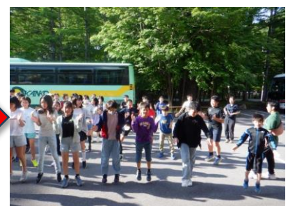
朝から「ジンギスカン」を踊り、じゃんけん大会で大盛り上がり！