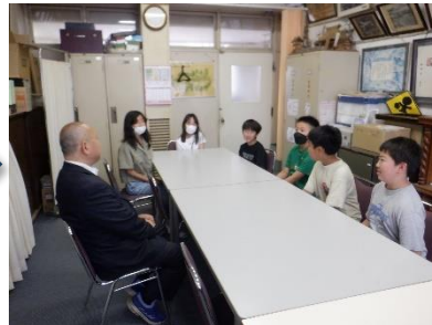
キャンプファイヤーの改革を校長に直訴する係の子供たち