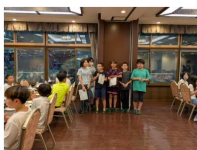
夕食前には、学年合同バスレクの大勝利大会の表彰式！