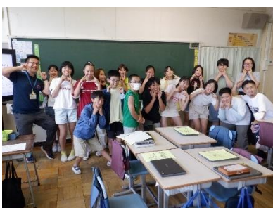
改革意欲満々の日光移動教室実行委員の6年生たち

一方の6年生。「子供たちがつくる学校プロジェクト」の中心となって学校を引っ張っている6年生にとっては、例年と違うことを企画することは、もはや「常識」です。日光移動教室実行委員会（二二ニコ日光プロジェクトチーム）を中心に、オリジナルキャラクターの作成、学年合同バスレク、テーマ曲選定、朝のオリジナル体操など、新たな取組をどんどん盛り込んで移動教室全体を大いに盛り上げました。6年生が移動教室で得た自信は、本校が2学期以降、一層パワーアップすることにつながりそうです。