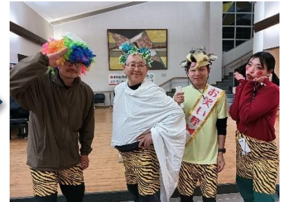
最高のキャンプファイヤーにすべく、気合の入る火の神とその子分たち