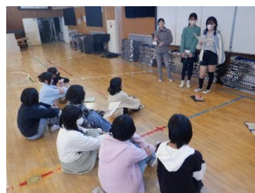
オーディションも子供たち中心で、厳しい審査が行われます！

今年度で3回目の開催となる「潤徳フェスティバル」。今回の開催は、2学期末となることから「潤徳フェスティバル×クリスマス」(略称：潤クリ)として、よりパワーアップします。個人またはグループによる「一芸発表会」とも言える本イベント、動画発表かステージ発表のどちらかで多くの児童が参加します。休み時間に行うため、教育課程上の公式行事ではない「潤クリ」ですが、栄光あるステージ発表を目指し、オーディションが連日行われるなど、早くもヒートアップしつつあります。