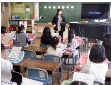
楽団の方による「MJ 合奏練習会」も連日開催！

特色ある学校づくり推進事業(後期)の対象でもある本事業。昨年度の「MJ コンサート」との大きな違いは、企画、調整、広報、運営等の全般を児童会本部役員の担当児童が進めていることです。