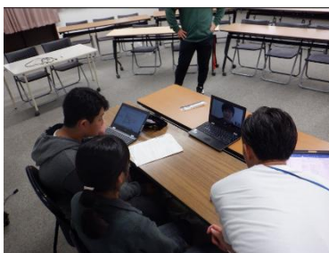
両校の幹部児童が着々と打ち合わせを進めています。

こちら、日野八小(以降、八小と表記)との特色ある学校づくり推進事業(後期)の対象で、2学期に入ってから、運動会の相互エール交換、4年生の演技鑑賞会、3年生の社会科の合同授業等、交流機会を増やしています。このたび、本校の児童会本部役員会、八小の代表委員会が協議を行い、以下の取組を2学期中に行う計画を立てました。